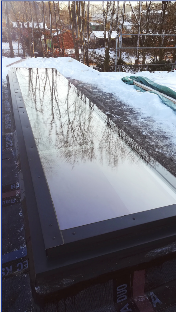
miniPLAN mit Festverglasung