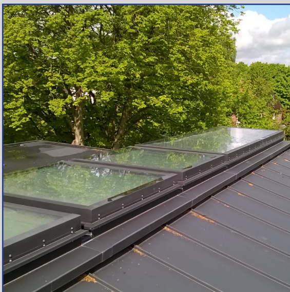
miniPLAN offenbar und feststehend

Die Betätigung erfolgt mithilfe eines Kettenantriebs.